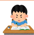
その子にあった 自立活動