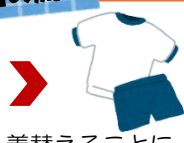
着替えることによって 気持ちの切り替えをする