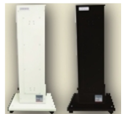
UVC エアステライザー